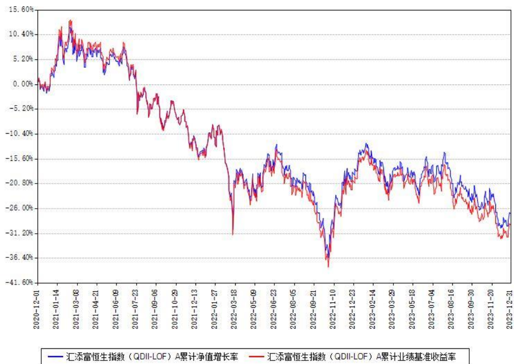
汇添富恒生指数 (QDII-LOF) A 累计净值增长率与同期业绩基准收益率对比图