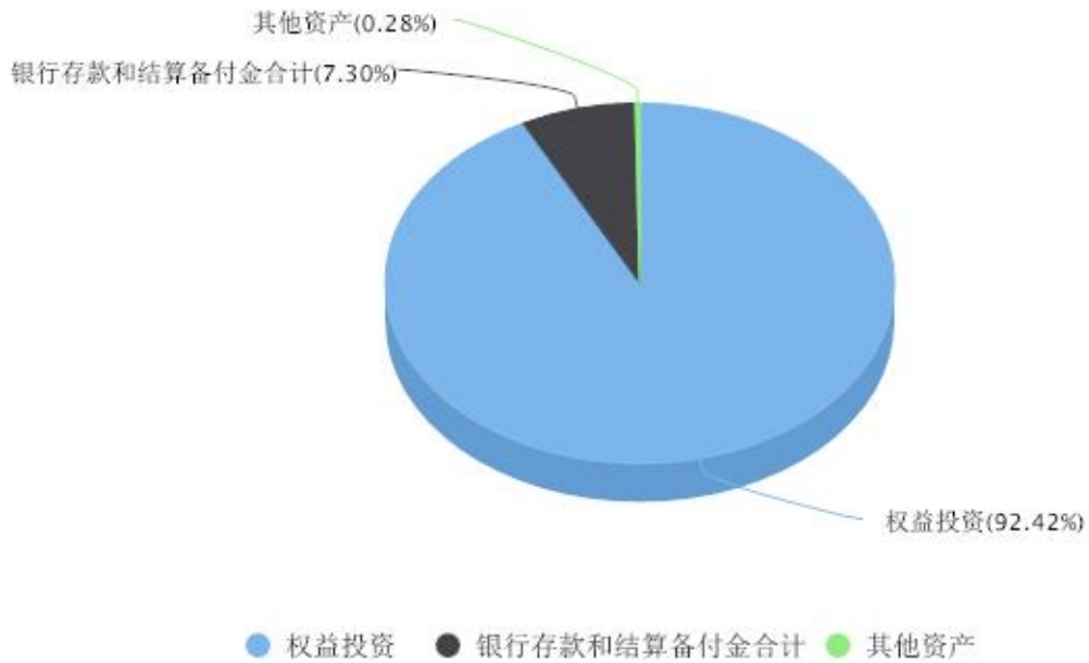
投资组合资产配置图表 数据截止日期:2023年12月31日