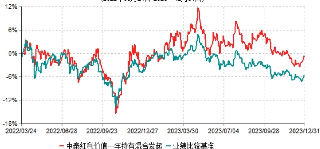
中泰红利价值一年持有期混合型发起式证券投资基金累计净值增长率与业绩比较基准收益率历史走势对比图 (2022年03月24日-2023年12月31日)