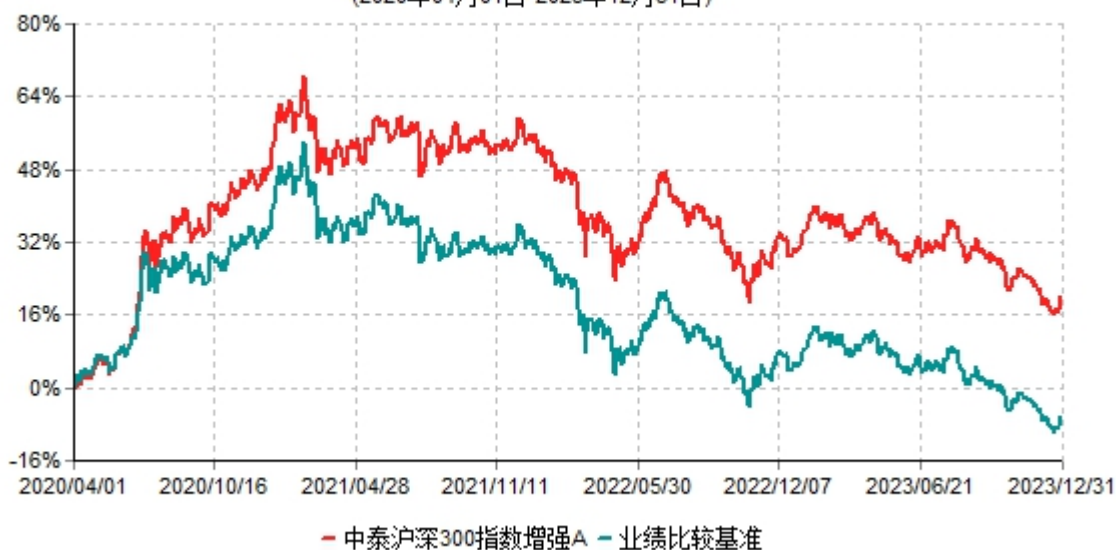
中泰沪深300指数增强A累计净值增长率与业绩比较基准收益率历史走势对比图 (2020年04月01日-2023年12月31日)