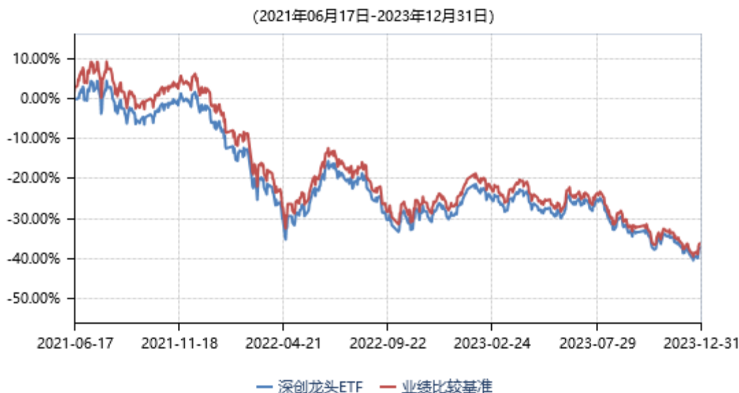
永赢深证创新100交易型开放式指数证券投资基金累计净值收益率与业绩比较基准收益率历史走势对比图