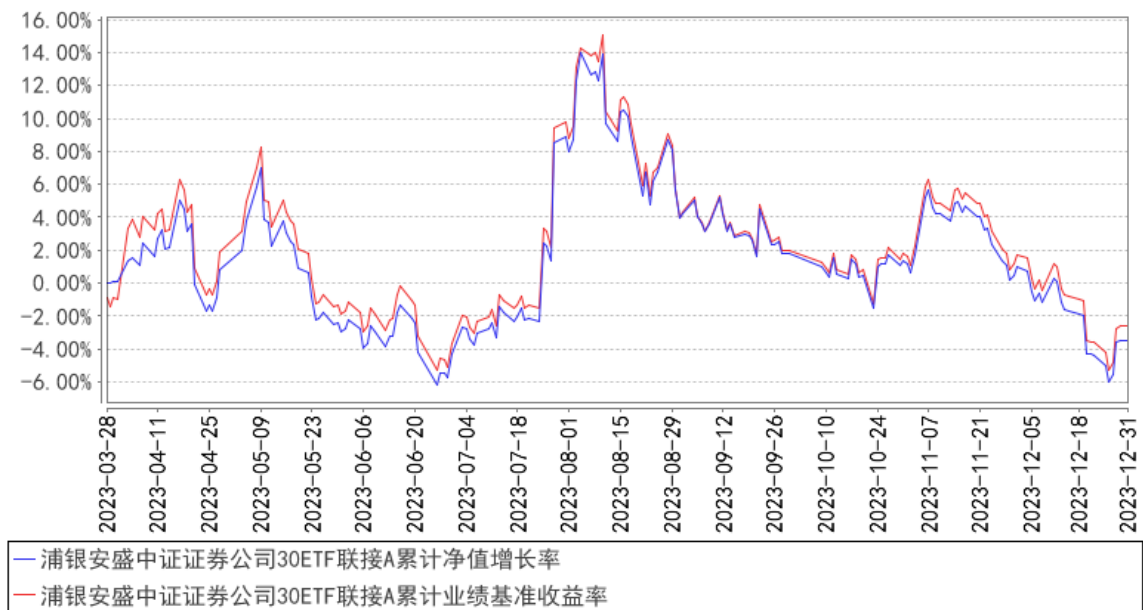
浦银安盛中证证券公司 30ETF 联接 A 累计净值增长率与同期业绩比较基准收益率的历史走势对比图