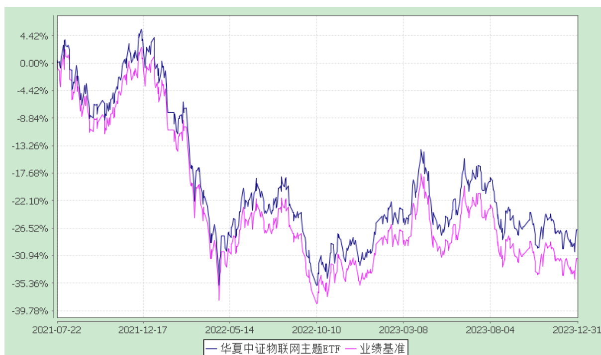
华夏中证物联网主题交易型开放式指数证券投资基金 份额累计净值增长率与业绩比较基准收益率历史走势对比图 (2021年7月22日至2023年12月31日)