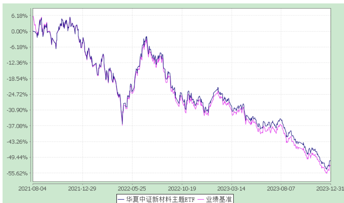
华夏中证新材料主题交易型开放式指数证券投资基金 份额累计净值增长率与业绩比较基准收益率历史走势对比图 (2021年8月4日至2023年12月31日)