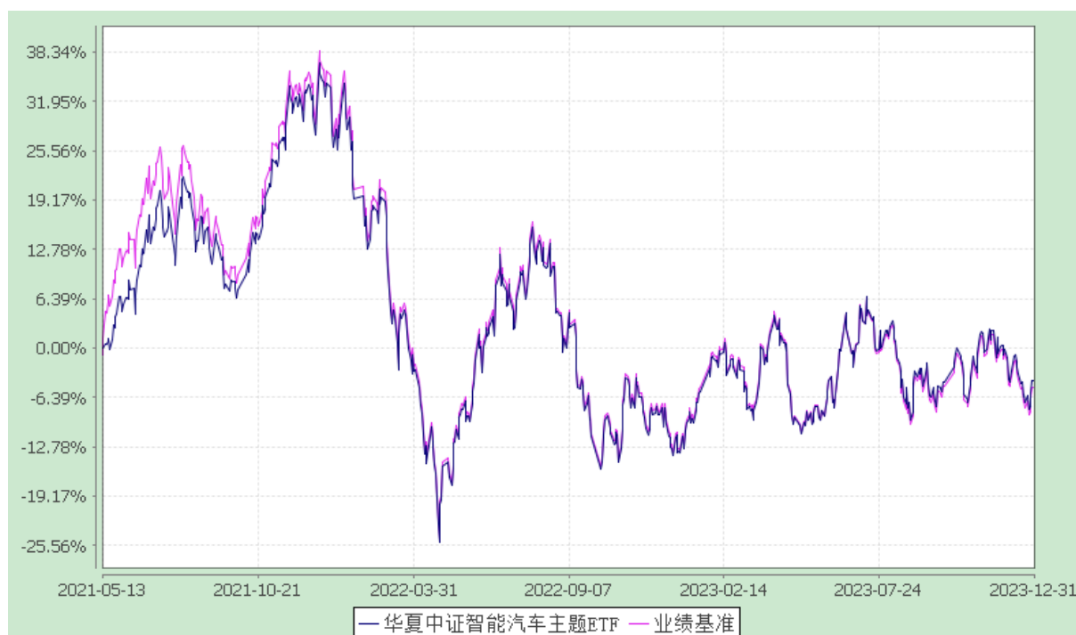
华夏中证智能汽车主题交易型开放式指数证券投资基金 份额累计净值增长率与业绩比较基准收益率历史走势对比图 (2021年5月13日至2023年12月31日)