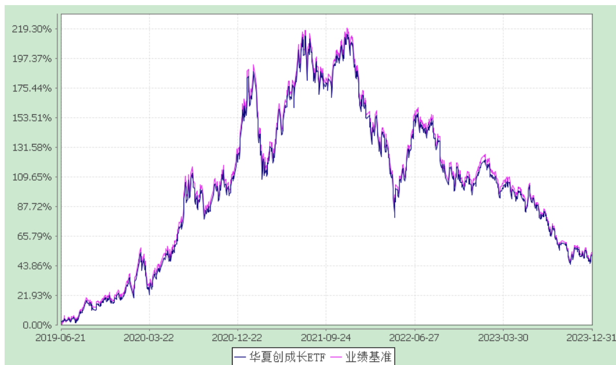
华夏创业板动量成长交易型开放式指数证券投资基金 份额累计净值增长率与业绩比较基准收益率历史走势对比图 (2019年6月21日至2023年12月31日)