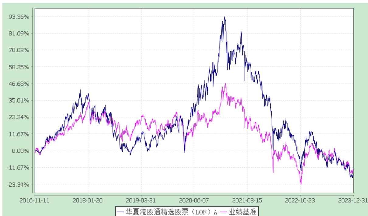
华夏港股通精选股票 C