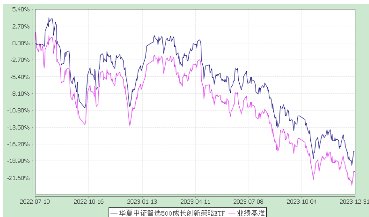
华夏中证智选 500 成长创新策略交易型开放式指数证券投资基金 份额累计净值增长率与业绩比较基准收益率历史走势对比图 (2022 年 7 月 19 日至 2023 年 12 月 31 日)

注：根据本基金的基金合同规定，本基金自基金合同生效之日起 6 个月内使基金的投资组合比例符合本基金合同中投资范围、投资限制的有关约定。