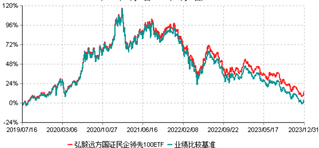
弘毅远方国证民企领先100交易型开放式指数证券投资基金累计净值增长率与业绩比较基准 收益率历史走势对比图 (2019年07月16日-2023年12月31日)

注：本基金基金合同生效日为2019年7月16日。截至建仓期结束，本基金各项资产配置比例符合基金合同及招募说明书有关投资比例的约定。