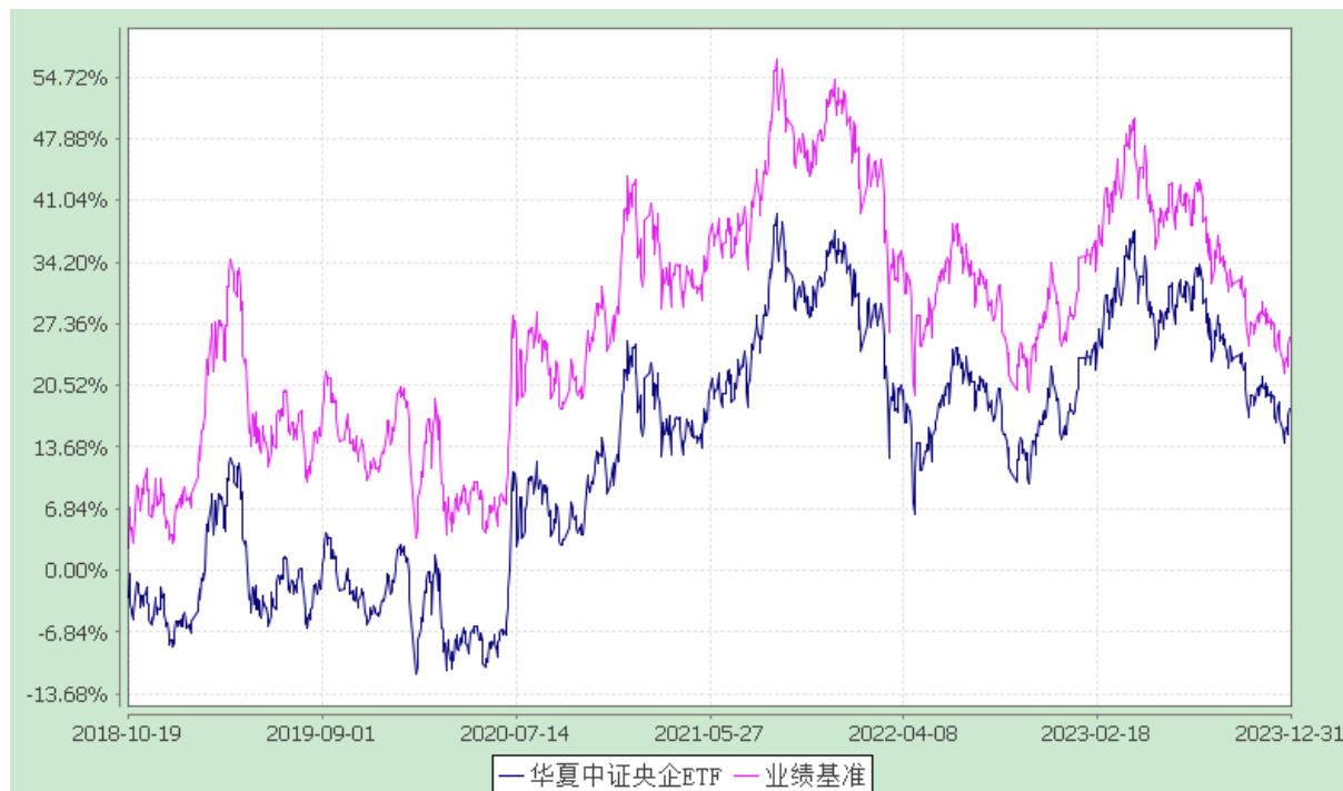
华夏中证央企结构调整交易型开放式指数证券投资基金 份额累计净值增长率与业绩比较基准收益率历史走势对比图 (2018年10月19日至2023年12月31日)