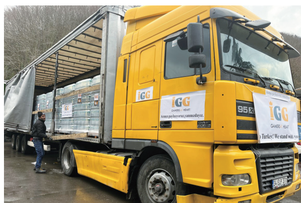
為地震災區捐贈救援物資