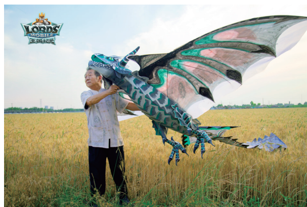
在遊戲中融入傳統文化元素