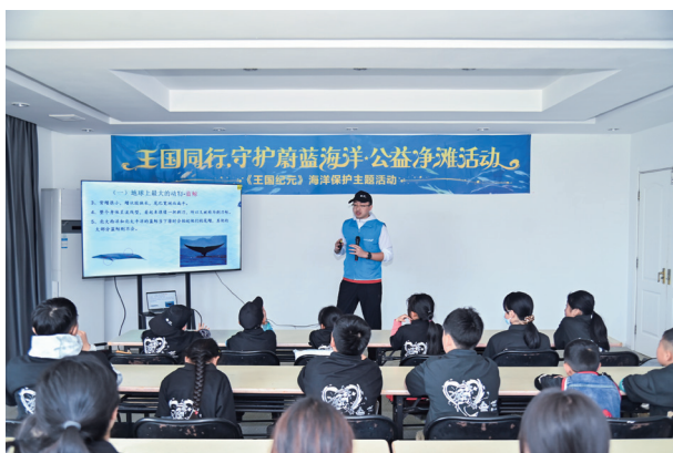
「守護蔚藍海洋」公益活動

我們為員工自發組建的公益社群提供活動平台舉行公益志願者活動，例如義賣等活動，通過跳蚤市場、銷售土特產品等方式為需要幫助的群體籌集善款。二零二三年，IGG員工參與香港地區願望成真基金會(Make-A-Wish Foundation)慈善籌款活動，為重病兒童達成心願。