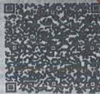
乔琪的年检二维码