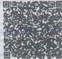
缪环宇年检二维码

本证书经检验合格，继续有效一年。 This certificate is valid for another year after this renewal.