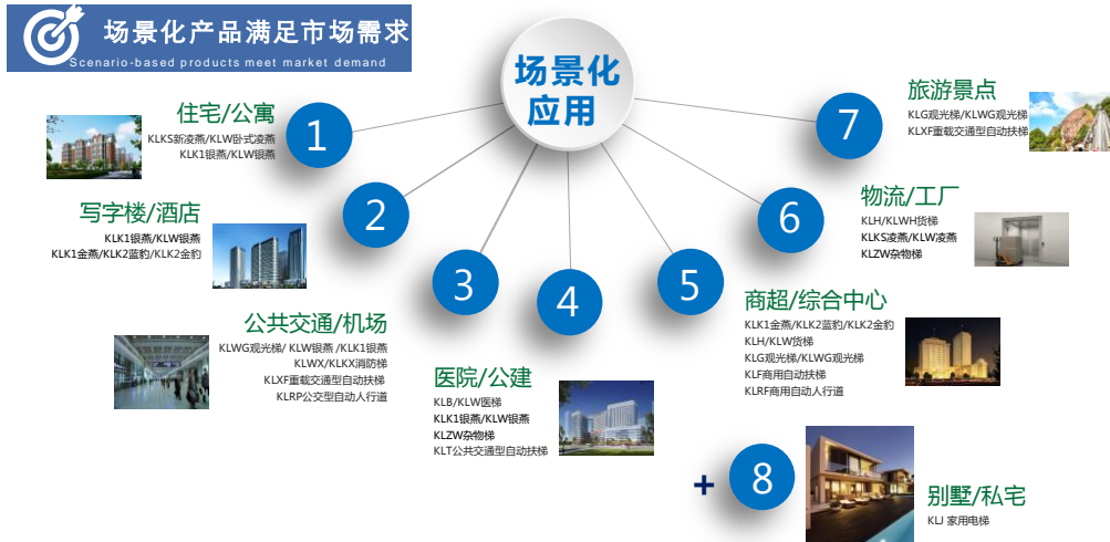
公司产品及应用场景

公司在国内建成 100 多个营销服务分支机构，规模行业内领先；近年连续成为碧桂园、中海地产、金茂、华润等众多中大型知名房企的供应商，并持续突破、新增重要战略级客户；同时公司在轨道交通站点用梯等重点项目的投标领域的市场竞争力持续上升，近年先后中标北京、苏州、深圳、成都等国内众多一二线城市重点项目，2022 年中标数量及中标总额排名领先。国际市场方面，公司产品已远销全球 100 多个国家和地区。