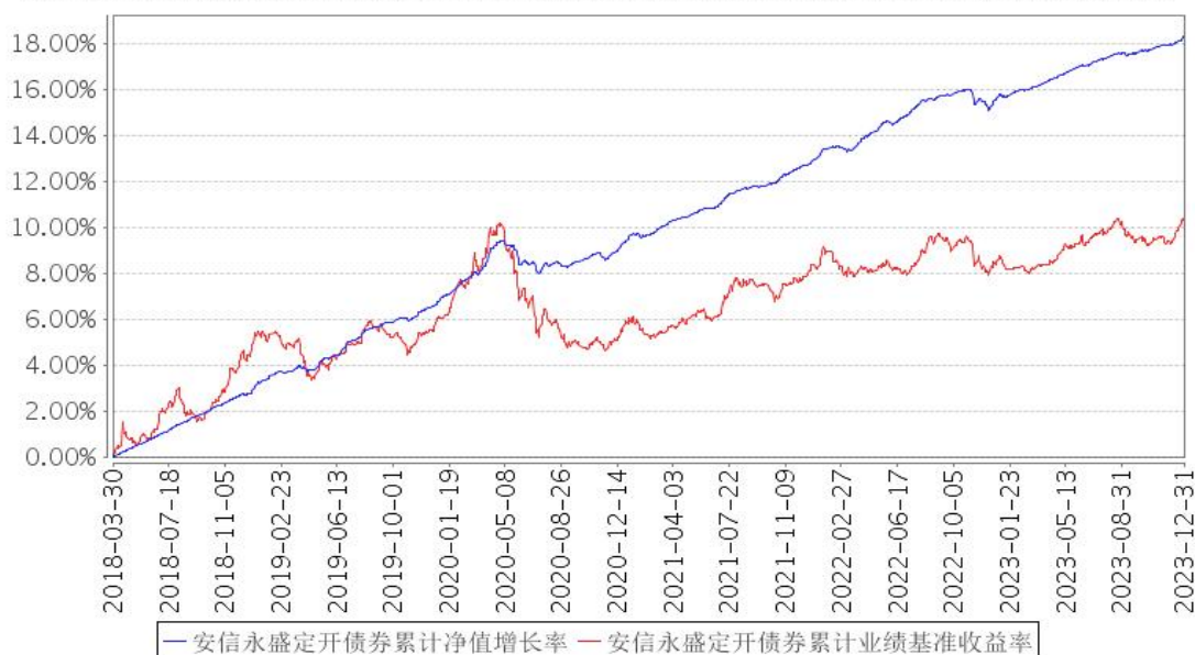
安信永盛定开债券累计净值增长率与同期业绩比较基准收益率的历史走势对比图