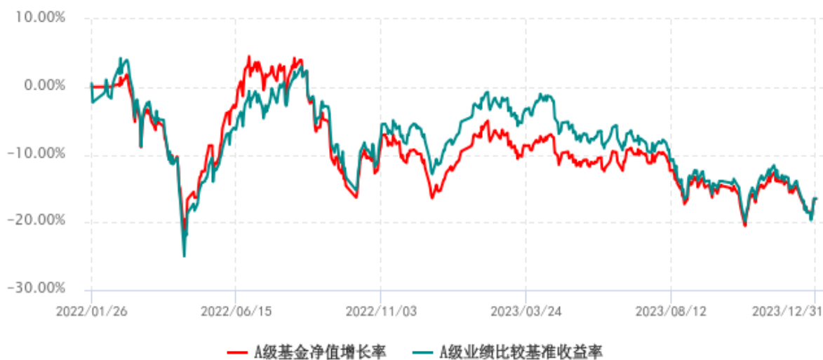
A 级基金份额累计净值增长率与同期业绩比较基准收益率历史走势对比图 (2022 年 01 月 26 日-2023 年 12 月 31 日)