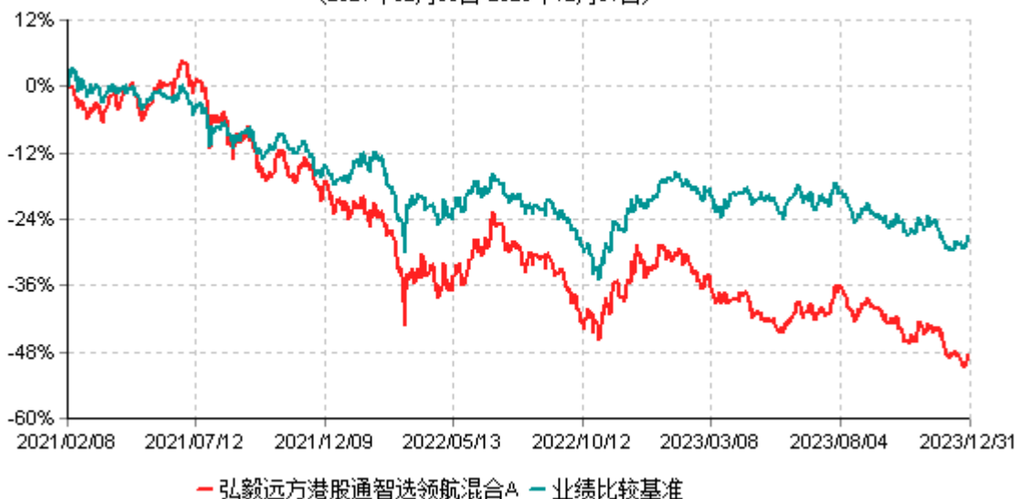
弘毅远方港股通智选领航混合A累计净值增长率与业绩比较基准收益率历史走势对比图 (2021年02月08日-2023年12月31日)