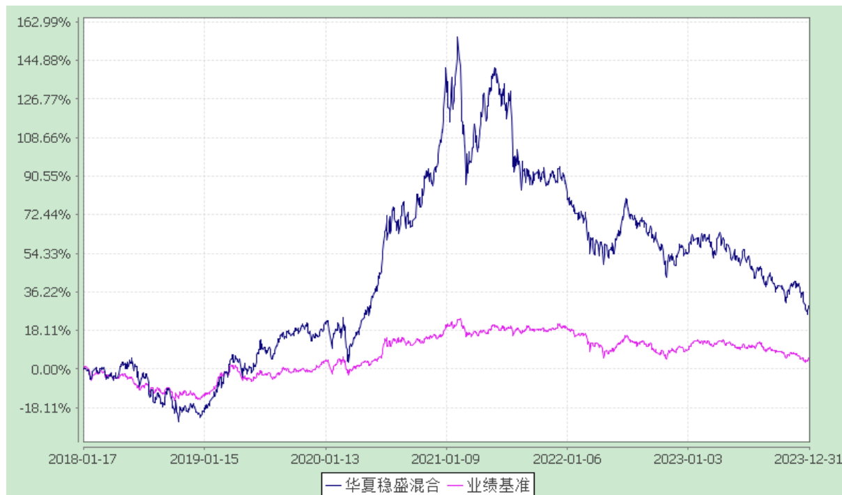
华夏稳盛灵活配置混合型证券投资基金 份额累计净值增长率与业绩比较基准收益率历史走势对比图 (2018年1月17日至2023年12月31日)