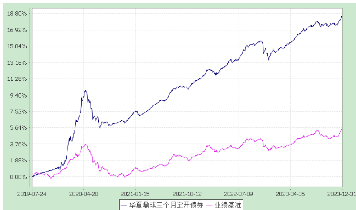
华夏鼎琪三个月定期开放债券型发起式证券投资基金 份额累计净值增长率与业绩比较基准收益率历史走势对比图 (2019年7月24日至2023年12月31日)