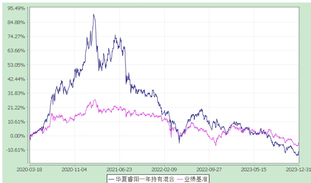
华夏睿阳一年持有期混合型证券投资基金 份额累计净值增长率与业绩比较基准收益率历史走势对比图 (2020年3月18日至2023年12月31日)