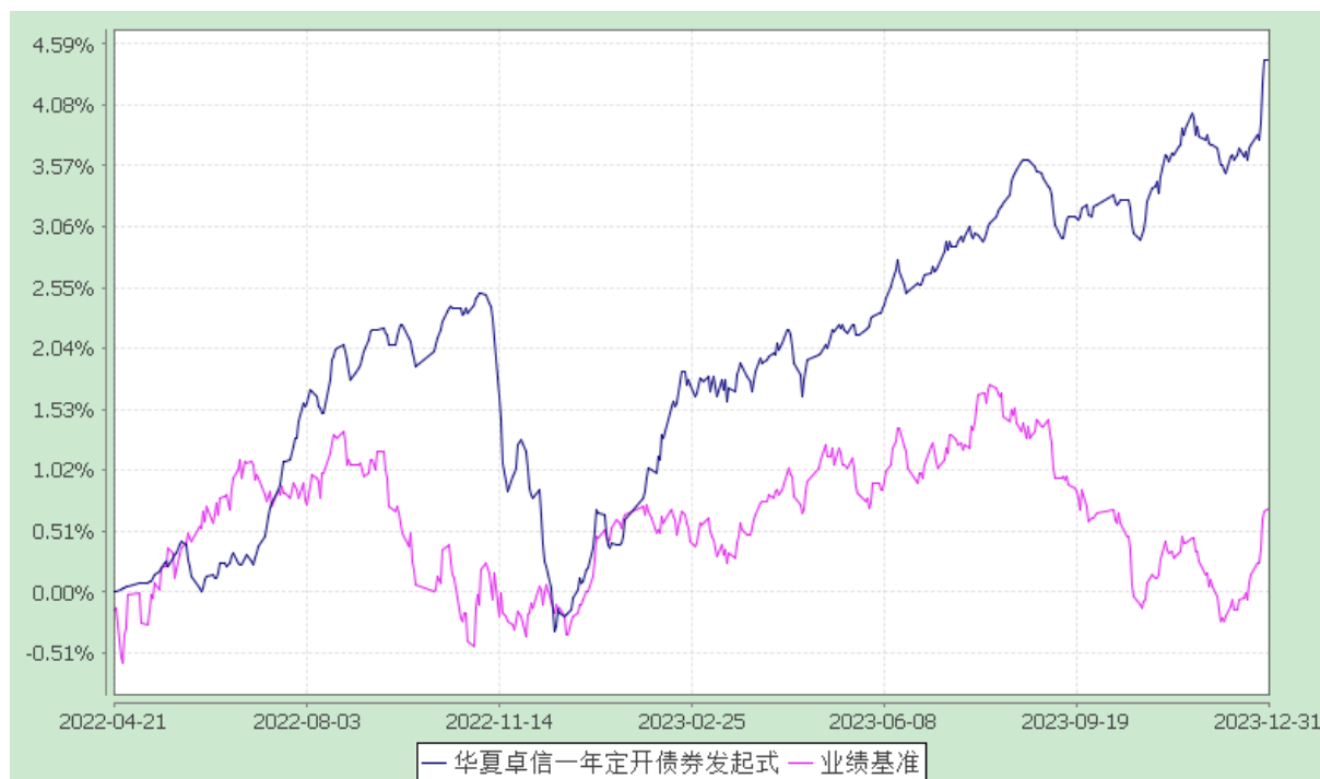
华夏卓信一年定期开放债券型发起式证券投资基金 份额累计净值增长率与业绩比较基准收益率历史走势对比图 (2022 年 4 月 21 日至 2023 年 12 月 31 日)