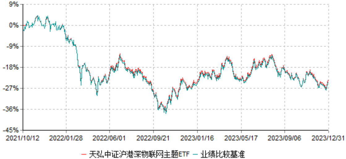
天弘中证沪港深物联网主题交易型开放式指数证券投资基金累计净值增长率与业绩比较基准 收益率历史走势对比图 (2021年10月12日-2023年12月31日)