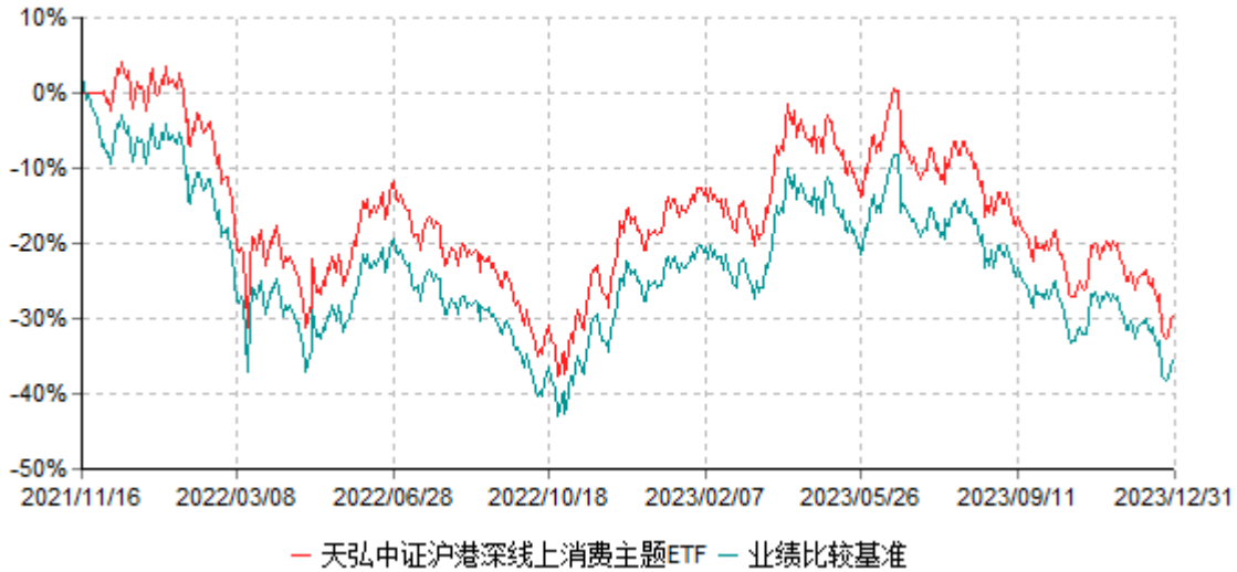
天弘中证沪港深线上消费主题交易型开放式指数证券投资基金累计净值增长率与业绩比较基准收益率历史走势对比图 (2021年11月16日-2023年12月31日)