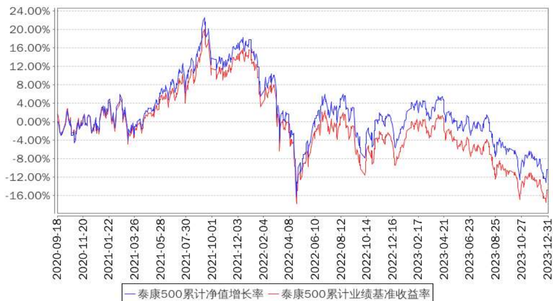
泰康500累计净值增长率与同期业绩比较基准收益率的历史走势对比图