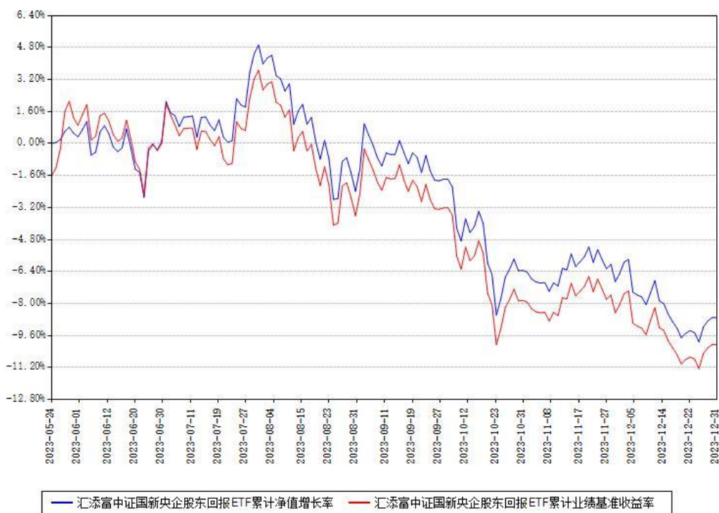
汇添富中证国新央企股东回报ETF累计净值增长率与同期业绩基准收益率对比图

注：本《基金合同》生效之日为2023年05月24日，截至本报告期末，基金成立未满一年。本基金建仓期为本《基金合同》生效之日起6个月，截至本报告期末，本基金已完成建仓，建仓期结束时各项资产配置比例符合合同约定。