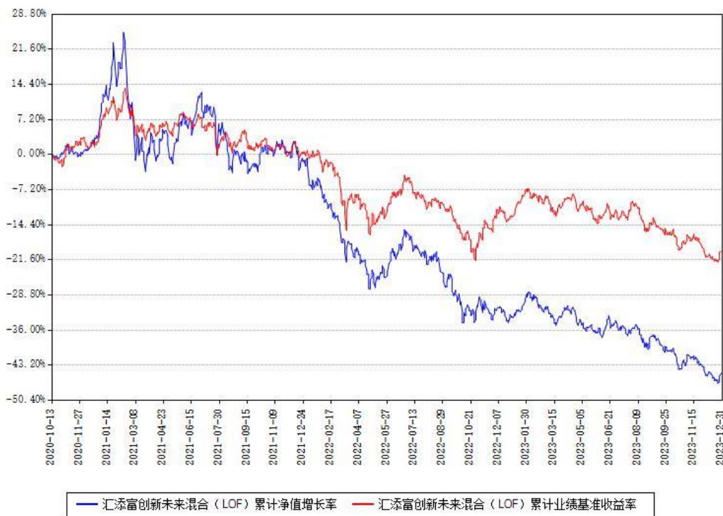
汇添富创新未来混合（LOF）累计净值增长率与同期业绩基准收益率对比图

注：本基金建仓期为本《基金合同》生效之日（2020年10月13日）起6个月，建仓期结束时各项资产配置比例符合合同约定。