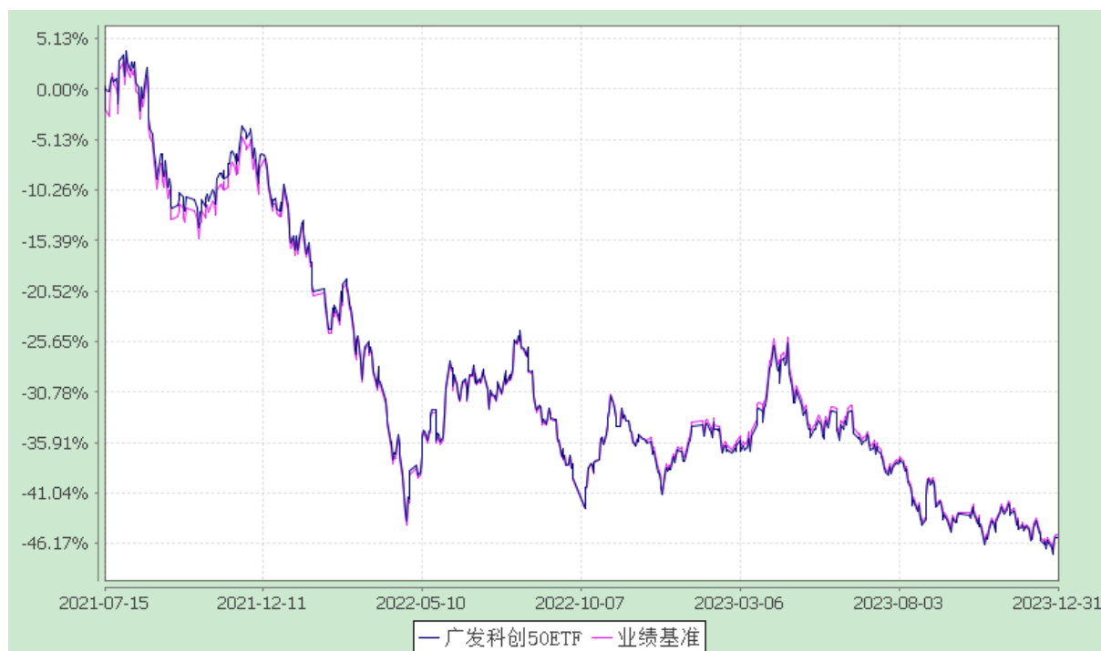
广发上证科创板 50 成份交易型开放式指数证券投资基金 份额累计净值增长率与业绩比较基准收益率的历史走势对比图 (2021 年 7 月 15 日至 2023 年 12 月 31 日)