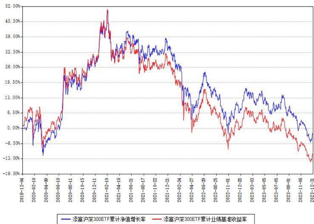
添富沪深300ETF累计净值增长率与同期业绩基准收益率对比图

注：本基金建仓期为本《基金合同》生效之日（2019年12月04日）起6个月，建仓期结束时各项资产配置比例符合合同约定。