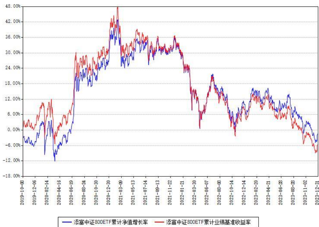
添富中证800ETF累计净值增长率与同期业绩基准收益率对比图

注：本基金建仓期为本《基金合同》生效之日（2019年10月08日）起6个月，建仓期结束时各项资产配置比例符合合同约定。