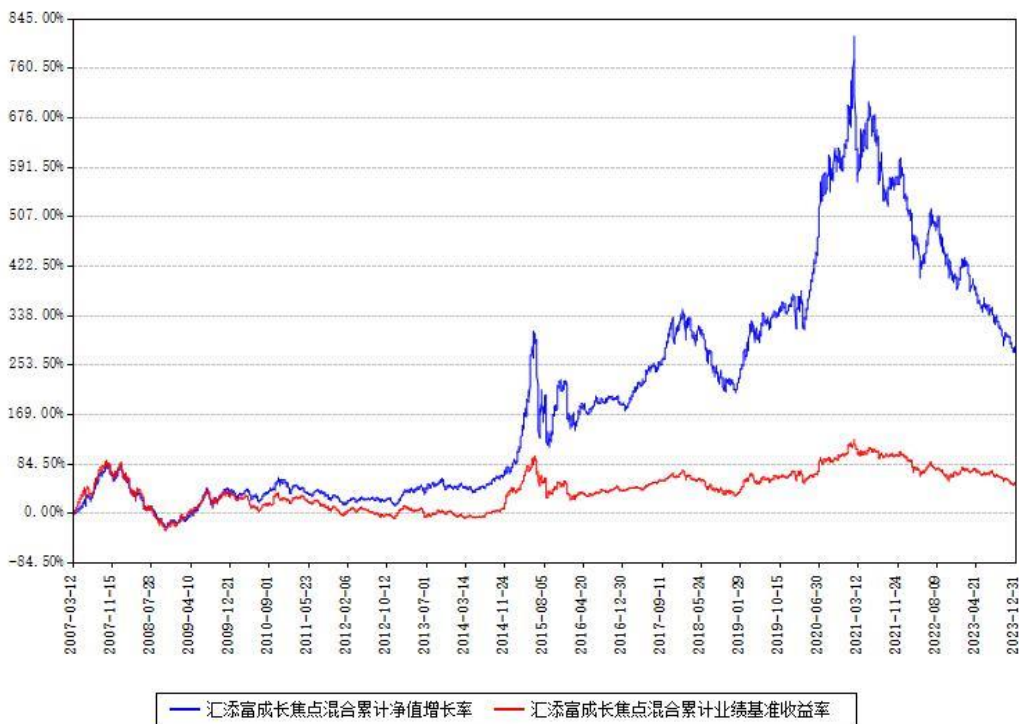
汇添富成长焦点混合累计净值增长率与同期业绩比较基准收益率对比图

注：本基金建仓期为本《基金合同》生效之日（2007年03月12日）起6个月，建仓期结束时各项资产配置比例符合合同约定。