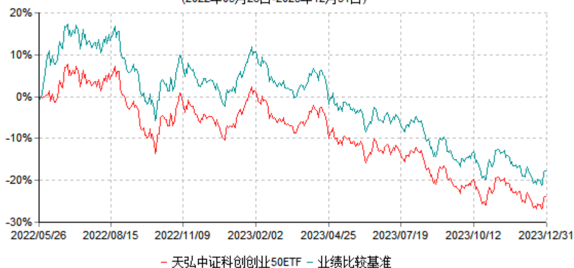
天弘中证科创创业50交易型开放式指数证券投资基金累计净值增长率与业绩比较基准收益率历史走势对比图 (2022年05月26日-2023年12月31日)