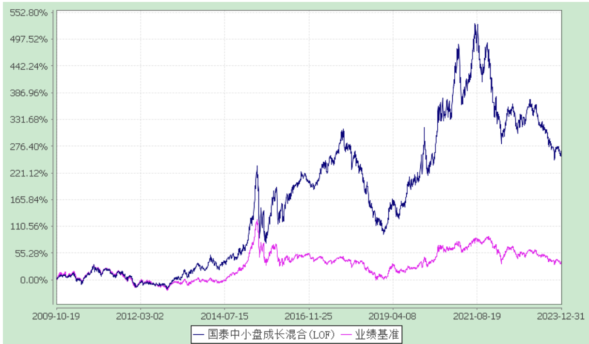
自基金合同生效以来份额累计净值增长率与业绩比较基准收益率的历史走势对比图 (2009 年 10 月 19 日至 2023 年 12 月 31 日)

注：本基金的转型日为 2009 年 10 月 19 日。本基金在六个月建仓期结束时，各项资产配置比例符合合同约定。