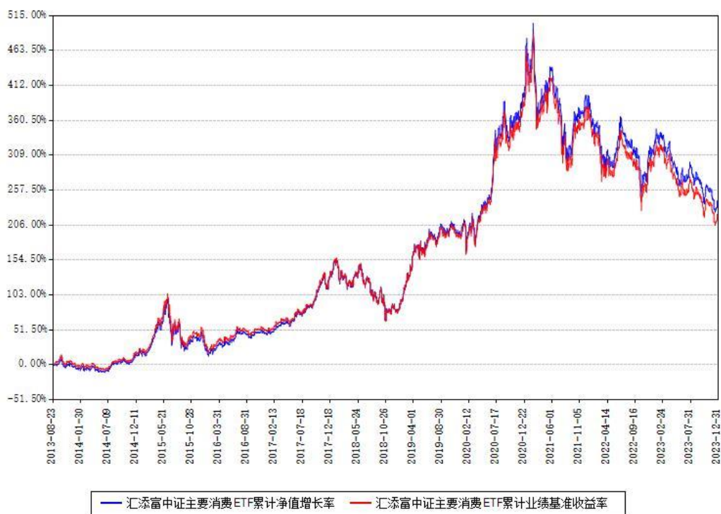
汇添富中证主要消费ETF累计净值增长率与同期业绩比较基准收益率对比图

注：本基金建仓期为本《基金合同》生效之日（2013年08月23日）起3个月，建仓期结束时各项资产配置比例符合合同约定。