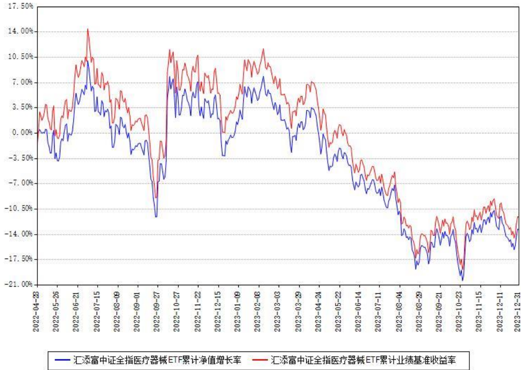
汇添富中证全指医疗器械ETF累计净值增长率与同期业绩基准收益率对比图

注：本基金建仓期为本《基金合同》生效之日（2022年04月28日）起6个月，建仓期结束时各项资产配置比例符合合同约定。