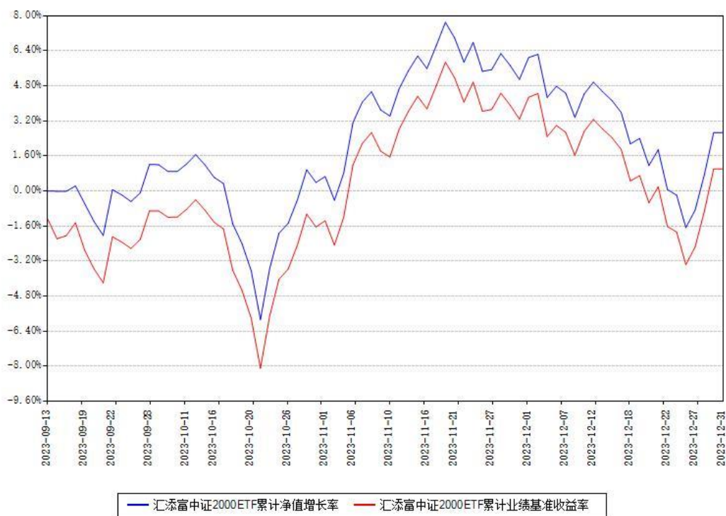
汇添富中证2000ETF累计净值增长率与同期业绩基准收益率对比图

注：本《基金合同》生效之日为 2023 年 09 月 13 日，截至本报告期末，基金成立未满一年。本基金建仓期为本《基金合同》生效之日起 6 个月，截至本报告期末，本基金尚处于建仓期中。