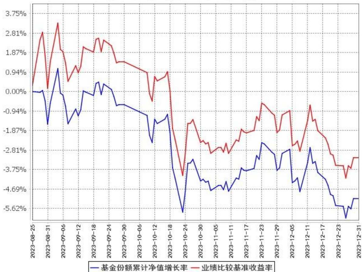
基金份额累计净值增长率与同期业绩比较基准收益率的历史走势对比图 (2023年8月25日至2023年12月31日)

注：(1) 本基金合同于 2023 年 8 月 25 日生效，截至报告期末基金合同生效未满一年。