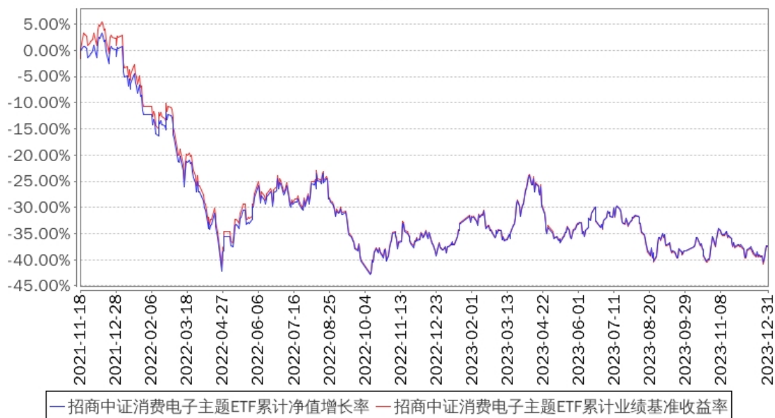
招商中证消费电子主题ETF累计净值增长率与同期业绩比较基准收益率的历史走势对比图