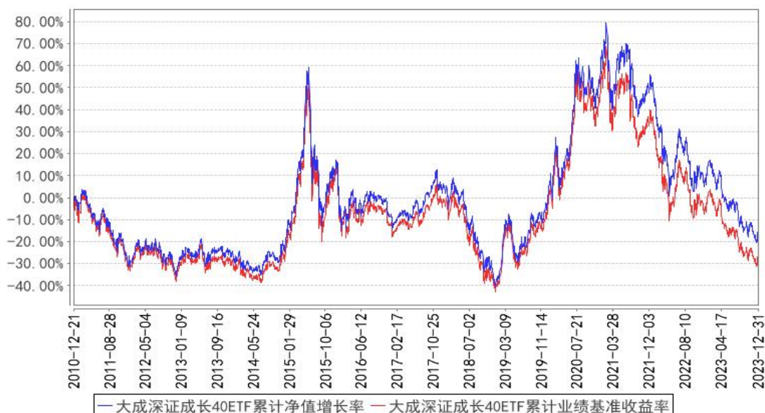
大成深证成长40ETF累计净值增长率与同期业绩比较基准收益率的历史走势对比图

注：本基金合同规定，基金管理人应当自基金合同生效之日起三个月内使基金的投资组合比例符合基金合同的约定。建仓期结束时，本基金的投资组合比例符合基金合同的约定。