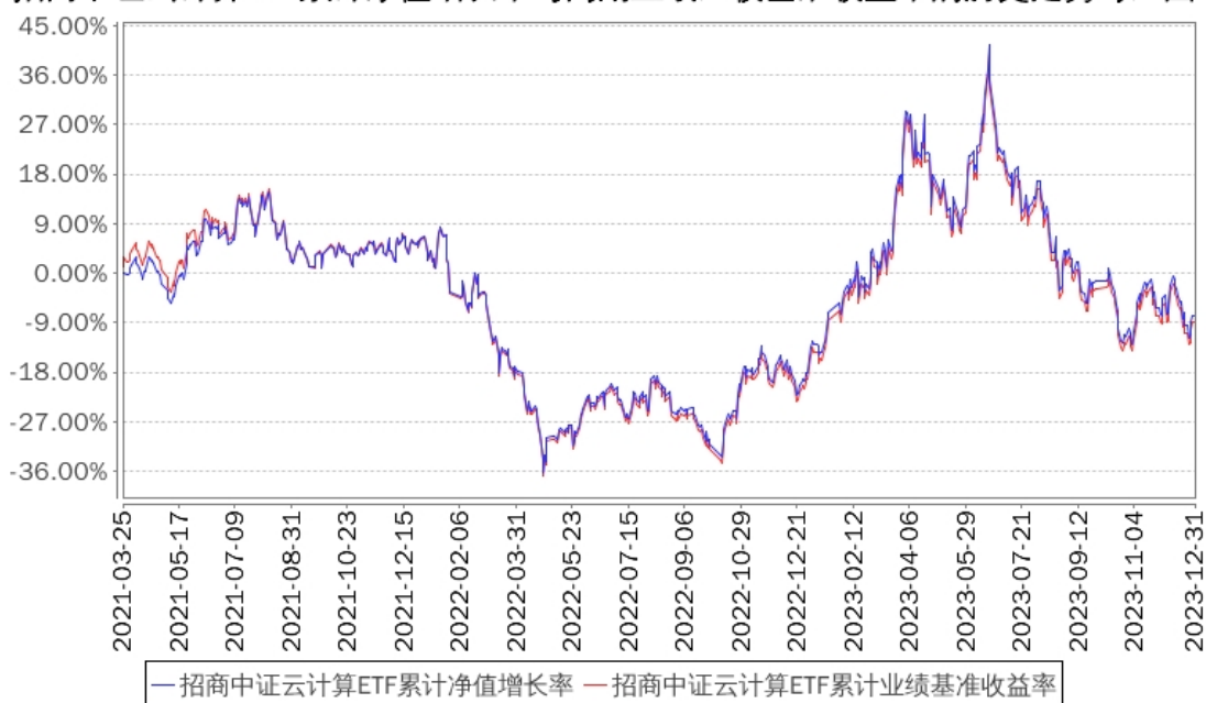
招商中证云计算ETF累计净值增长率与同期业绩比较基准收益率的历史走势对比图