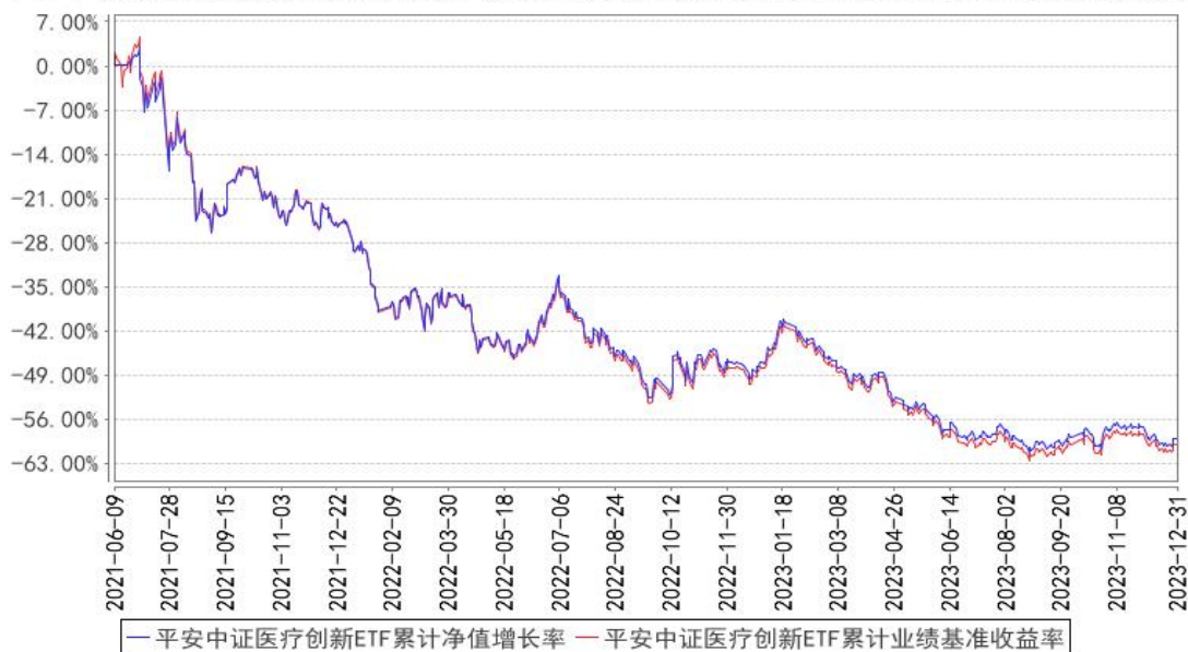
平安中证医疗创新ETF累计净值增长率与同期业绩比较基准收益率的历史走势对比图