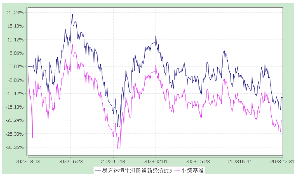
易方达恒生港股通新经济交易型开放式指数证券投资基金 份额累计净值增长率与业绩比较基准收益率历史走势对比图 (2022年3月3日至2023年12月31日)