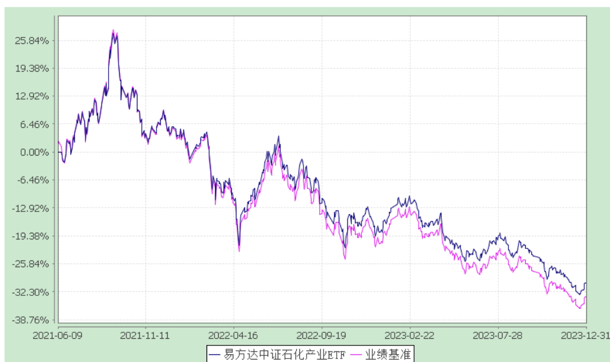
易方达中证石化产业交易型开放式指数证券投资基金 份额累计净值增长率与业绩比较基准收益率历史走势对比图 (2021年6月9日至2023年12月31日)

注：自基金合同生效至报告期末，基金份额净值增长率为-30.27%，同期业绩比较基准收益率为-33.57%。