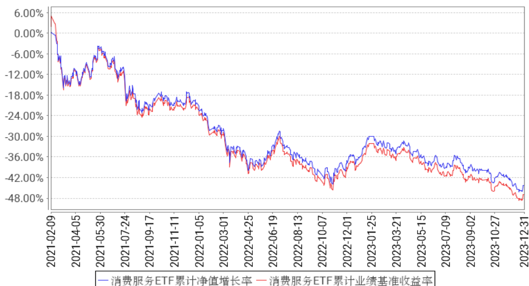
消费服务ETF累计净值增长率与同期业绩比较基准收益率的历史走势对比图