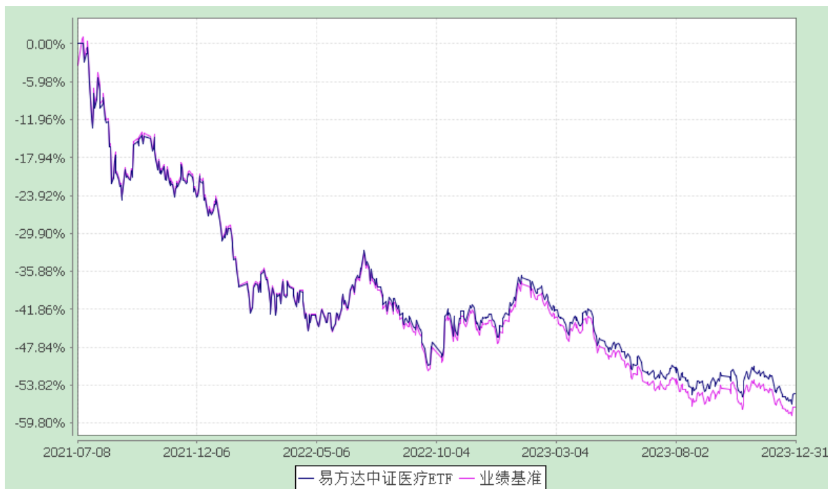
易方达中证医疗交易型开放式指数证券投资基金 份额累计净值增长率与业绩比较基准收益率历史走势对比图 (2021 年 7 月 8 日至 2023 年 12 月 31 日)

注：自基金合同生效至报告期末，基金份额净值增长率为-55.24%，同期业绩比较基准收益率为-57.24%。