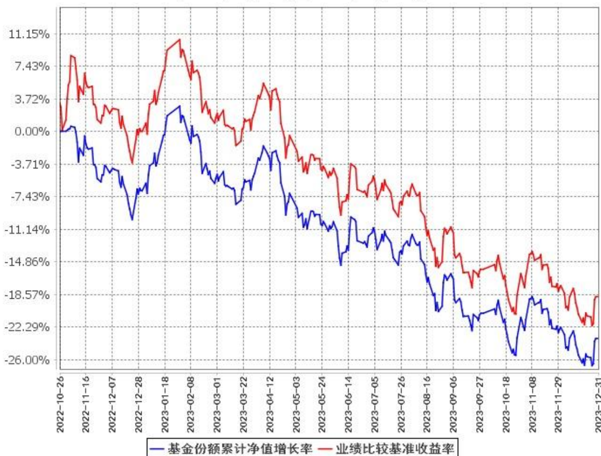
基金份额累计净值增长率与同期业绩比较基准收益率的历史走势对比图 (2022年10月26日至2023年12月31日)

注：按基金合同规定，本基金的建仓期为自基金合同生效之日起 6 个月。建仓期结束时，本基金的投资组合比例符合本基金合同的有关规定。