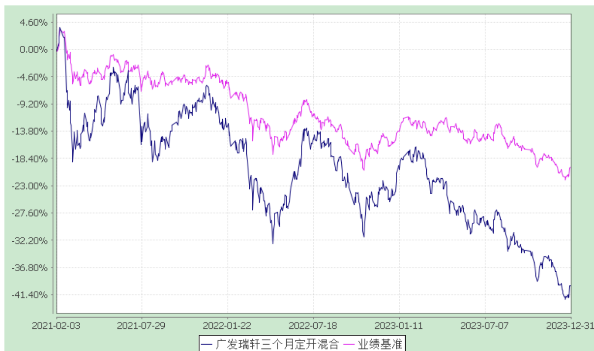
广发瑞轩三个月定期开放混合型发起式证券投资基金 份额累计净值增长率与业绩比较基准收益率的历史走势对比图 (2021年2月3日至2023年12月31日)