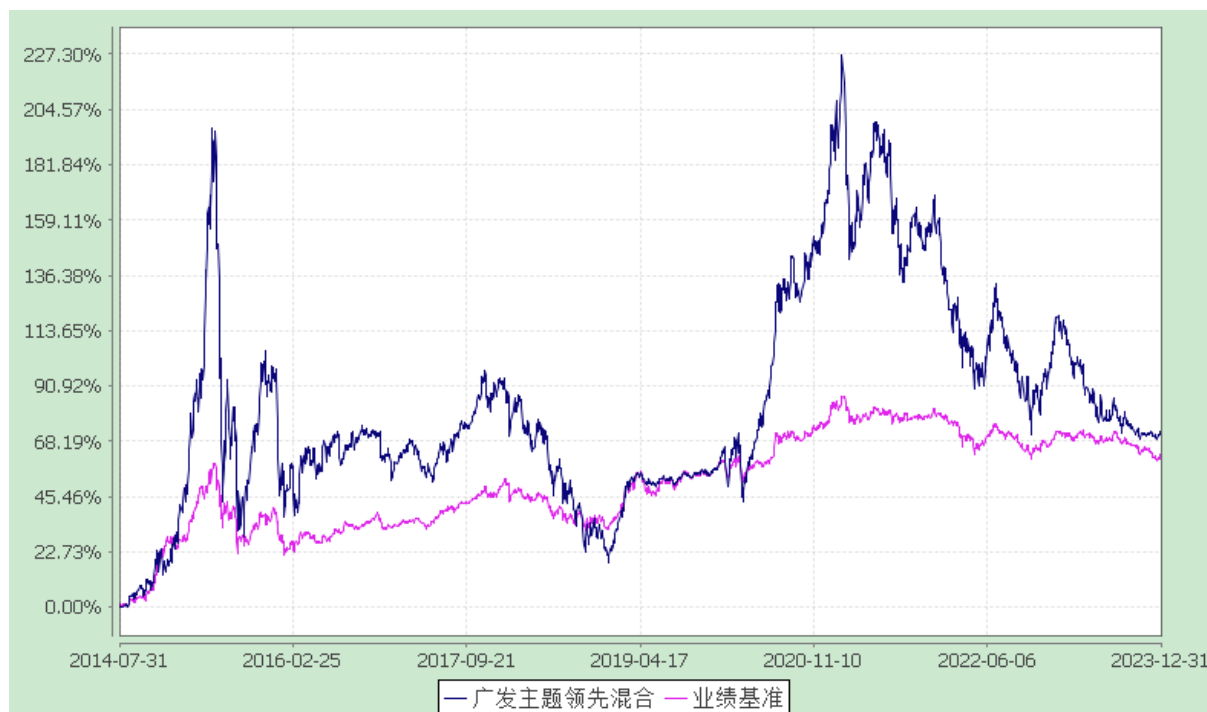
广发主题领先灵活配置混合型证券投资基金 份额累计净值增长率与业绩比较基准收益率的历史走势对比图 (2014 年 7 月 31 日至 2023 年 12 月 31 日)

注：自 2019 年 11 月 7 日起，本基金的业绩比较基准由“沪深 300 指数×50%+中证全债指数×50%”变更为“沪深 300 指数×40%+中债-综合财富（总值）指数×50%+银行活期存款利率（税后）×10%”。